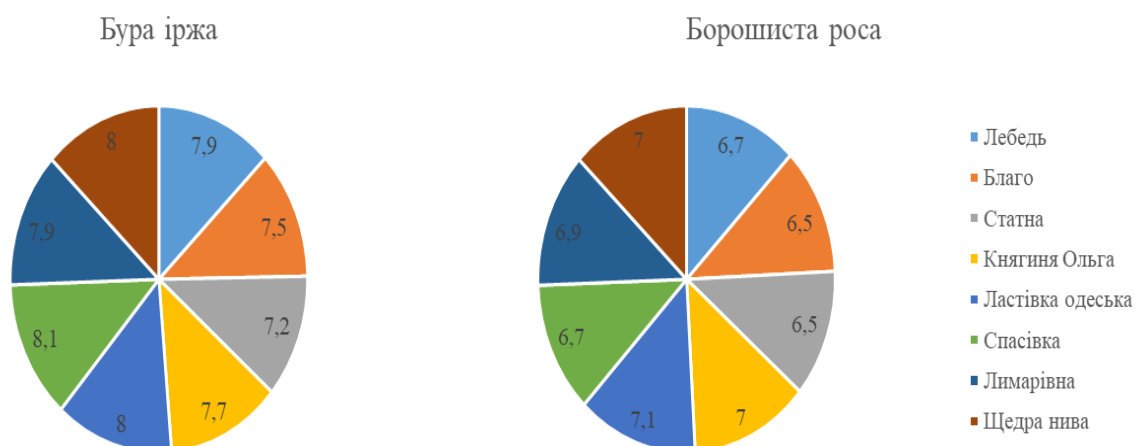
Рис. 3. Характеристика колекційних сортотразків пшениці м'якої озимої за стійкістю до листостеблових хвороб, балів (2009–2011 рр.).

ли в ґрунті є достатня кількість вологи [12, 13]. Також зміщення строків сівби пшениці у бік більш пізніх зумовлено розширенням посівів на півдні України таких нетипових культур, як соняшник, кукурудза та соя, врожай яких збирають в пізні терміни.