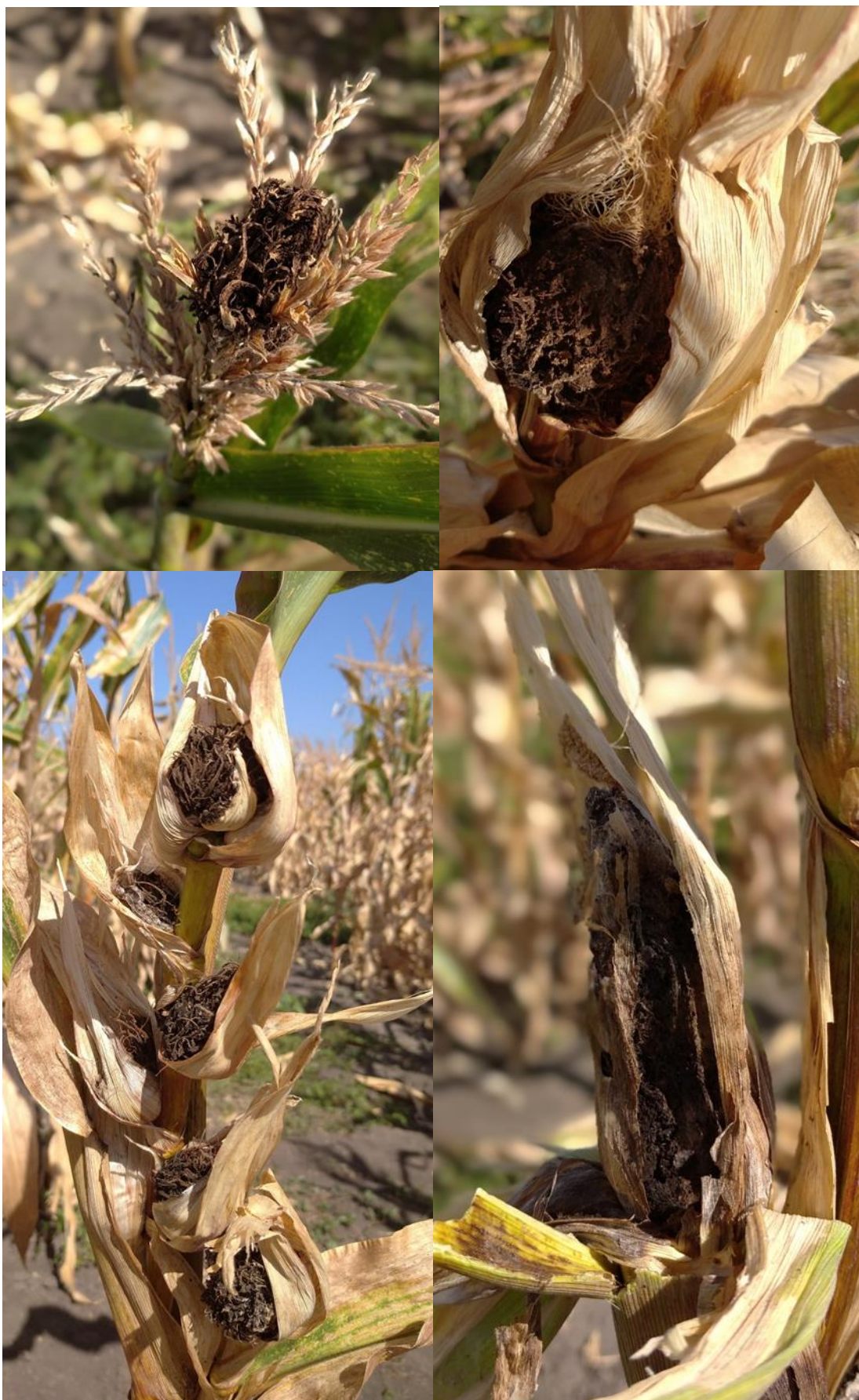
Рис. 2 Характерні ознаки хвороби рослин кукурудзи на летючу сажку в польових дослідях.